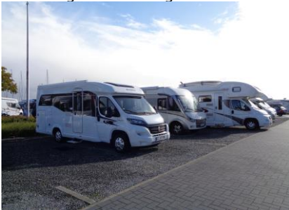
På Stellpladsen i Schleswig

Så er vi kommet hjem efter bryllupsfesten, og vi har fået sovet ud. Så efter morgenmaden, blev bilen pakket og vi kørte mod IMC for at skifte bil, men først skulle vi lige et smut i Lidl i Harrislee, så vi kunne få lidt proviant med. Nede ved IMC fik vi læsset over i camperen og kunne stille vores bil ind i carporten. 😊 Vi fik tanket camperen med frisk vand og kunne trille af sted ad landevejen til Schleswig. Vi fandt let frem til Stellpladsen, hvor vi mødte en camper på vej ud fra Stellpladsen. Godt den var kørt, for der var kun en ledig plads, og den bakkede vi ind på og fik strøm sat til. 😊