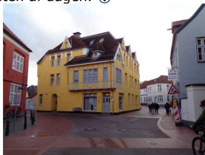
Hus med påmalet bindingsværk