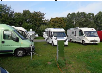
Stellpladsen i Eckernförde

Efter 2 dejlige dage i Damp var det tid til at køre videre. Vi havde set på vejrudsigten, og den var perfekt til at drage videre til Eckernförde. Hen ad formiddagen valgte vi at køre ad de mindre veje frem til Stellplatz am Noor i Eckernförde. Vi gjorde holdt udenfor bommen, og fik os tjekket ind, og med et kort kunne vi åbne bommen og køre ind for at finde en plads mellem de andre Camperere, der holdt på pladsen. Vi fandt hurtigt en plads som passede til os, og efter vi havde fået strøm på Camperen, var det tid til en velkomst drink, men da vi ikke lige var til øl, så blev det til en Ouzo, inden vi gik en tur ind i Eckernförde. Vi gik forbi "nærbutikken" SKY (50 m væk) og gennem en tunnel under