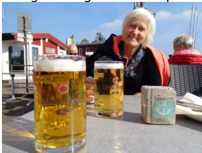
Dejlig frokost på Siegfried-Werft, Eckernförder Fischsuppe und Bier