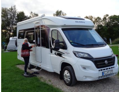
Så er vi klar til at gå en tur i Damp

Vi havde flot solskin, da vi vågnede efter en nat med masser af blæst og regn. Vinden havde lagt sig, men der kom stadig nogle gode pust, især når skyerne så lidt sorte ud, men regnen var stoppet inden vi stod op. Vi nød morgenen og formiddagen med at gå en tur rundt om "Maas". En dejlig gåtur på stien rundt om Maasholm. Da vi kom ned til fiskerihavnen, satte vi os på en bænk og nød solen i læ for vinden. Vi kunne se sejlere komme på læns inde fra Kappeln, og turbåden som kom fra Kappeln for at lægge til i Maasholm, inden den fortsatte ud til Schleimünde med passagerer, og så igen tog turen tilbage til Kappeln. 😊 Da vi havde tanket D-vitamin nok, gik vi tilbage til