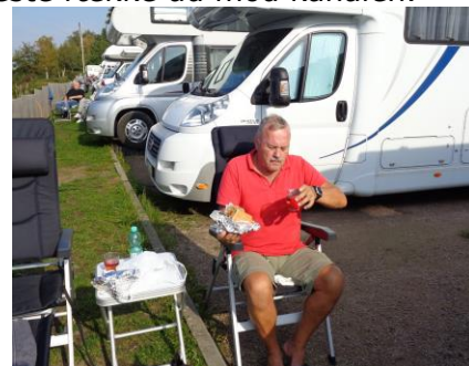
Kebab til frokost

2 flotte Kebab, som vi tog med hjem til Camperen som middagsmad. Vi satte os i solen foran Camperen, og kunne nyde de store skibe som sejlede forbi, mens vi nød den fantastiske gode Kebab med et glas Rose, "Portugischer Weinherbst". 😊 😊 Godt mætte kunne vi nyde eftermiddagen foran Camperen, i det dejlige solskin, mens kæmpe store skibe sejlede forbi i begge retninger. Allersidst på eftermiddagen, trak vi indenfor, hvor vi stadig mætte efter den store Kebab, kunne nyde resten af dagen, og se lidt fjernsyn indtil sengetid.