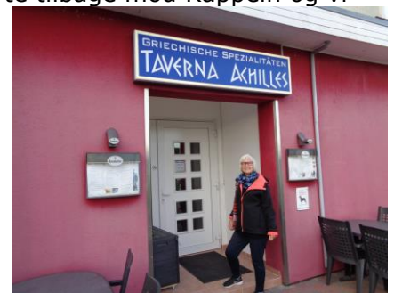
Vi glæder os til god mad

gamle flådestation. Da vi kom frem, blev vi noget skuffede, det så ud som store firkantede kasser med ferielejligheder inde bag et lukket område. Vi fik vendt og kørte tilbage mod Kappeln og videre mod Damp, hvor vi fandt Stellpladsen, som ligger lige ved "Wassersport" banen, hvor man kan stå på vandski. ☹️ Vi fik Camperen parkeret og nød det dejlige vejr foran camperen med en enkelt øl i solen, så vi kunne få tanket yderligere D-vitaminer. Der kom lidt skyer, dog uden regn, men vi trak indenfor, hvor vi hyggede os, indtil vi gik en tur og senere hen på Taverna Akropolis for at spise til aften. Vi fik en "Grillteller Akropolis" med en øl til. Det kan vi anbefale! 😊 Efter vi havde spist og nydt Ouzoen, gik vi tilbage til Camperen, hvor vi slappede af indtil sengetid. Nå ja, vi prøvede, om vi kunne finde nogle kanaler på TV, men uden held. Vores antenne kunne ikke finde noget på DTV, så det blev til hygge med radio, PC og iPad. ☹️