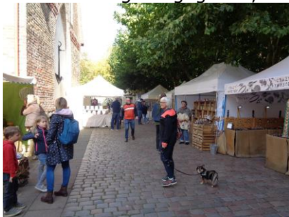
Hygge i Eckernförde

Alsterwasser. Efter lidt ventetid fik vi vores Eckernförder Fischsuppe, med masser af lækkert fyld, som vi rigtig nød i det dejlige solskin. Efter vi havde betalt, gik vi en runde på havnen og gennem Altstadt tilbage til gågaden, som vi fulgte tilbage mod Camperen, hvor vi slappede af i solen. 😊