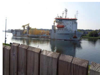
Noget af skibstrafikken på Nordostsee Kanal