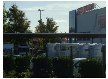
Flotte efterårsfarver på træerne undervejs hjem