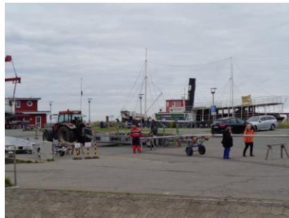
Minderne fra Damp blev opfrisket