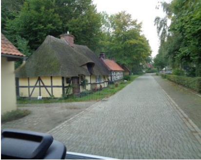
Det gamle Damp (Altstadt)

Efter morgenmaden hyggede vi os, indtil vi sidst på formiddagen gik en tur ind til Damp.