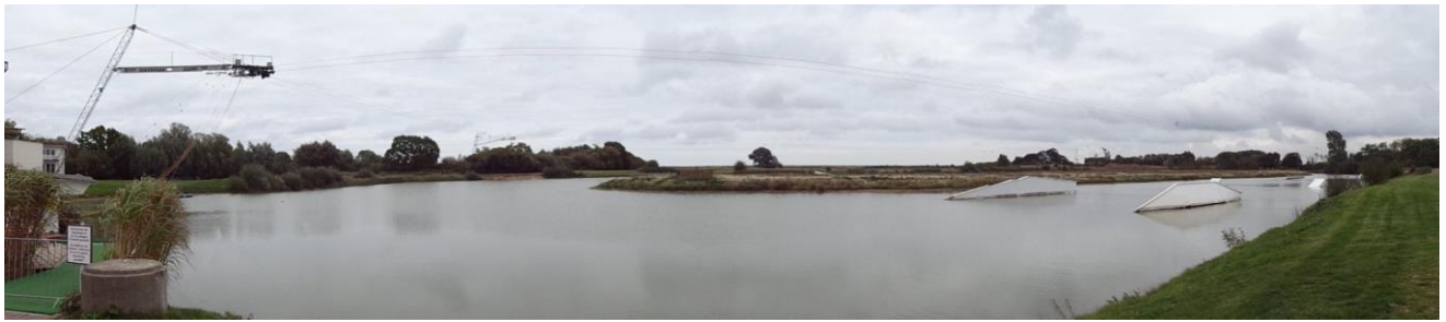
Wassersport Banen ved siden af Stellpladsen