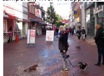
Gågaden i Schleswig

Så er vi kommet hjem efter bryllupsfesten, og vi har fået sovet ud. Så efter morgenmaden, blev bilen pakket og vi kørte mod IMC for at skifte bil, men først skulle vi lige et smut i Lidl i Harrislee, så vi kunne få lidt proviant med. Nede ved IMC fik vi læsset over i camperen og kunne stille vores bil ind i carporten. 😊 Vi fik tanket camperen med frisk vand og kunne trille af sted ad landevejen til Schleswig. Vi fandt let frem til Stellpladsen, hvor vi mødte en camper på vej ud fra Stellpladsen. Godt den var kørt, for der var kun en ledig plads, og den bakkede vi ind på og fik strøm sat til. 😊