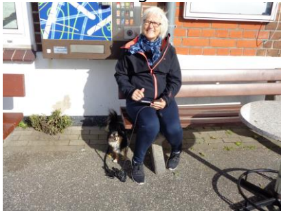
Solen nydes på Havnen

Det regnede stadig, men vi fik sat strøm på og tændt for varmen. Jeg kunne se på et opslag, at "Platzwart" kom rundt og krævede penge op, mellem kl. 17.00 og 18.00, så vi satte os og nød en velkomstdrink, bestående af en Ouzo. Efter en times tid stoppede regnen, og vi gjorde klar til at gå en tur i det lille fiskerleje. Senere læste vi og slappede af resten af dagen.