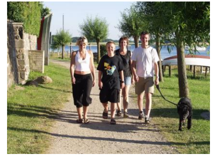
Familien på Samme sti i 2003