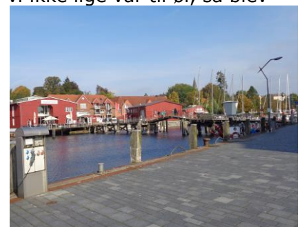
Den gamle bro på Havnen

den store Bundesstrasse mod Kiel, og snart var vi inde ved gågaden, som vi fulgte ned mod havnen og den gamle gangbro. Vi gik over broen og fandt et bord på Siegfried-Werft, hvor vi efter lidt ventetid fik bestilt en Eckernförder Fischsuppe og lidt at drikke til. Jeg tror ikke, de havde regnet med, at det blev et fantastisk vejr, ja næsten sommerligt, for der manglede betjening, men i det dejlige solskin kunne vi starte med at nyde vores Øl /