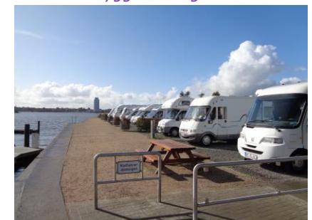
Stellplatz helt ud til Schlei