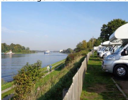
Udsigt til Nordostsee Kanal

Efter en kølig nat på en super god Stellplads, havde vi besluttet os for, endnu en gang på denne tur at dagens tur skulle være til et andet mål, nemlig Schacht-Audorf ved Nordostseekanal.