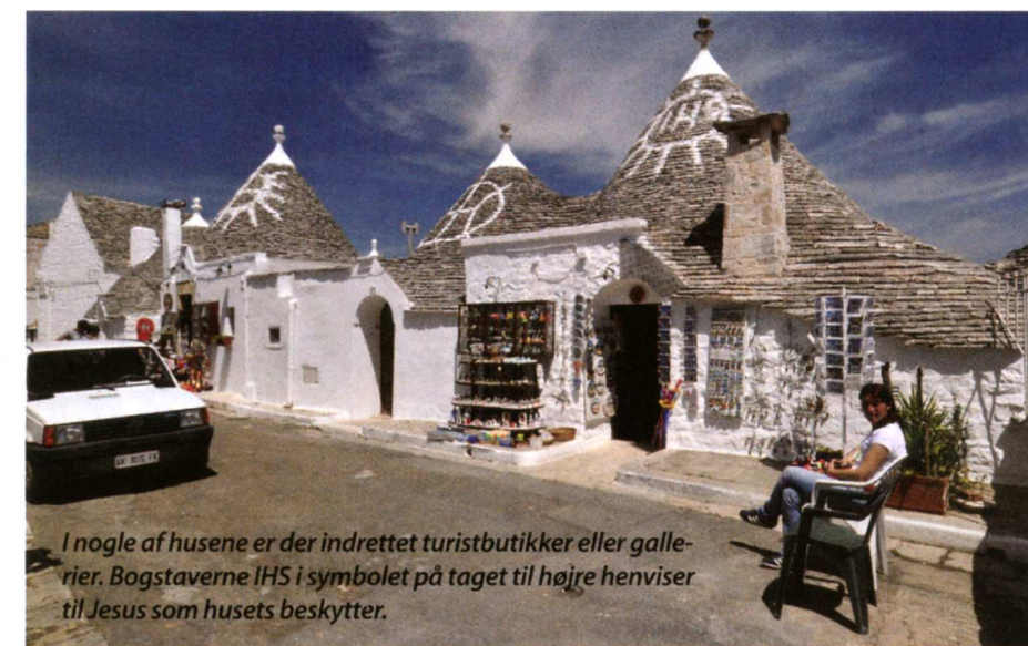
I nogle af husene er der indrettet turistbutikker eller gallerier. Bogstaverne LHS i symbolet på taget til højre henviser til Jesus som husets beskytter.

De tykke stenmure skulle angiveligt bervirke, at der er et behageligt indeklima.