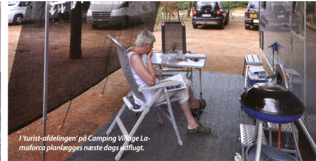
I 'turist-afdelingen' på Camping Village Lamaforca planlægges næste dags udflugt.

Camping Village Lamaforca er en Camping Cheque-plads til 400 enheder – i højsæsonen. Her midt i forsæsonen var vi maksimalt 10 turister plus måske lige så mange fastligere. Dette prægede i øvrigt hele vores tur; et enkelt sted var vi kun 2-3 enheder. Temmelig kedeligt faktisk, - ud over, at mange faciliteter er sat på standby, butikker og servicebygninger lukket ned osv. Således også her på Lamaforca, som bl.a. var ubemandet det meste af tiden. Man skulle