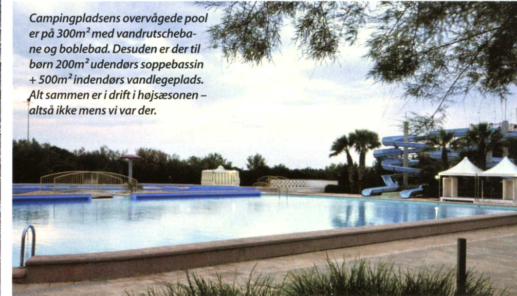
Campingpladsens overvågede pool er på 300m 2 med vandrukschebane og boblebad. Desuden er der til børn 200m 2 udendørs soppebassin + 500m 2 indendørs vandlegeplads. Alt sammen er i drift i højsæsonen – altså ikke mens vi var der.