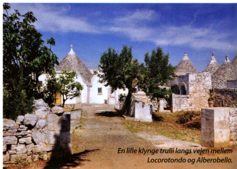
En lille klynge trulli langs vejen mellem Locorotondo og Alberobello.

søgt lignende stenhuse, fx Les Borries i Provence. Men trulli-husene skulle være noget helt særligt. Og hold da op, - det var de!