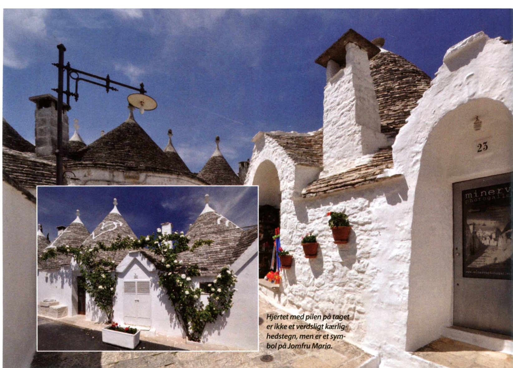
Hjertet med pilen på taget er ikke et verdsligt kærlighedstegn, men er et symbol på Jomfru Maria.