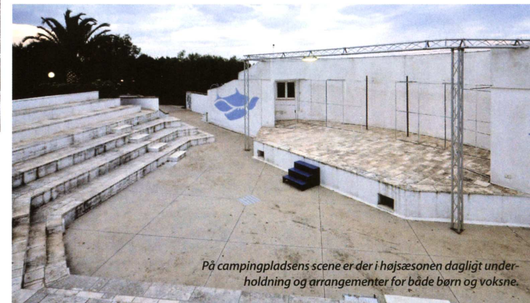
På campingpladsens scene er der i højsæsonen dagligt underholdning og arrangementer for både børn og voksne.

ringe efter vagten! Men vi skulle jo også kun bruge pladsen som base for vore udflugter rundt i det smukke Apulien, hvor vi bl.a. ville besøge den spændende by Alberobello med dens særprægede, kridhvide trullihuse med de spøjse, grålige tage. Jeg har en gang set, at nogle kalder Alberobello for