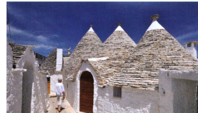
Det er spændende at slentre gennem Alberobellos smalle gader og tage husene i nærmere øjesyn.

Locorotondo. Udsigten fra husenes balkoner og terrasser ud over Itria-dalen må være flot.