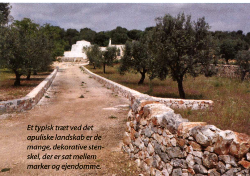
Et typisk træ ved det apuliske landskab er de mange, dekorative sten-skel, der er sat mellem marker og ejendomme.