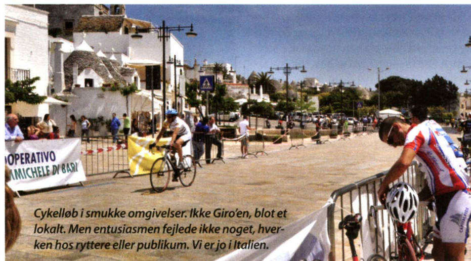
Cykelløb i smukke omgivelser. Ikke Giro'en, blot et lokalt. Men entusiasmen fejlede ikke noget, hverken hos ryttere eller publikum. Vi er jo i Italien.