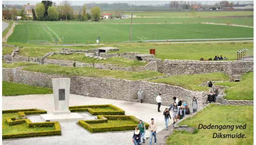
Dodengang ved Diksmuide.