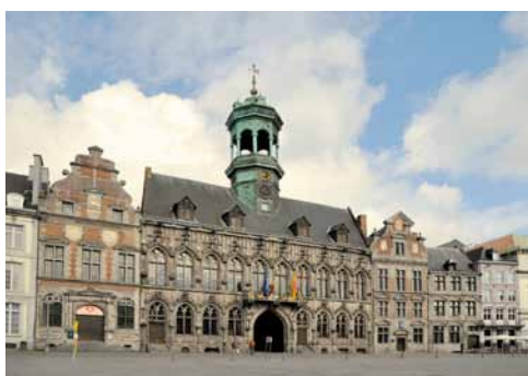
Rådhuset i Mons.