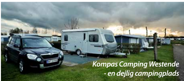
Kompas Camping Westende - en dejlig campingplads