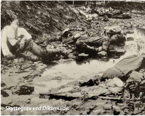
Skyttegrav ved Diksmuide.