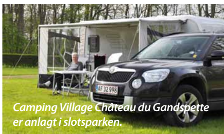
Camping Village Château du Gandspette er anlagt i slotsparken.

I og omkring den smukke by Ypres døde 600.000 unge mænd under 1. verdenskrig.