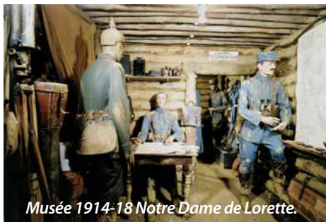
Musée 1914-18 Notre Dame de Lorette.