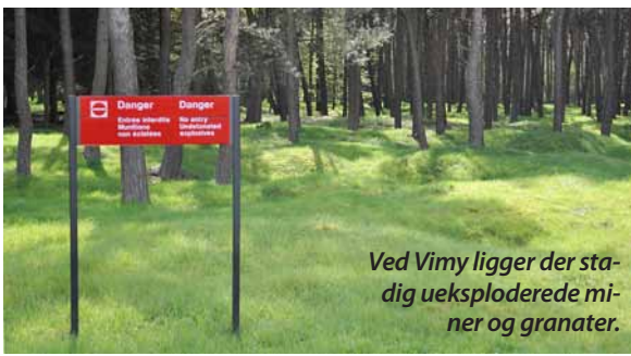
Ved Vimy ligger der stadig ueksploderede miner og granater.