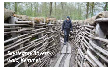
Skyttegrav Bayern- wald, Kimmel.