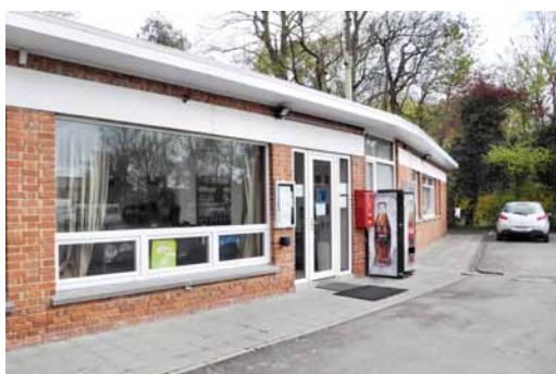
Camping du Wauxhall i Mons.

Den 12. aug. 1914 mellem kl. 12.30 og 14.30 var min morfar for første gang i kamp her på marken uden for Halen.