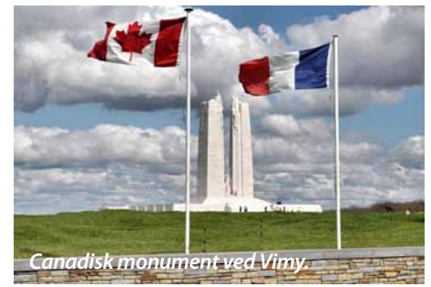
Canadisk monument ved Vimy.

– I løbet af 300 dage og nætter – fra 21. februar til 19. december 1916 - faldt der ikke mindre end 26.000.000 bomber og granater (6 pr. m 2 ) på slagmarkerne ved Verdun. Et område på ca. 20 km 2 .