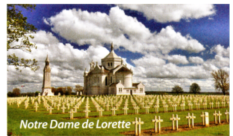
Notre Dame de Lorette