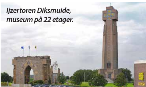
Ijzertoren Diksmuide, museum på 22 etager.