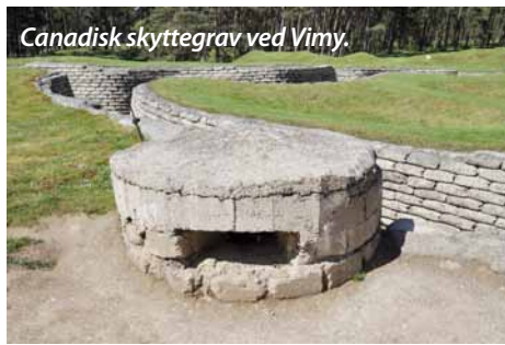
Canadisk skyttegrav ved Vimy.