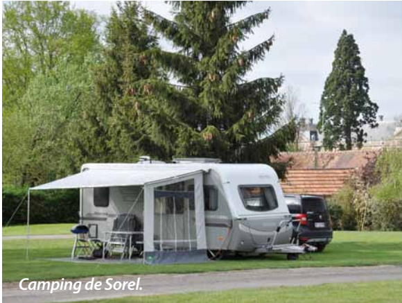
Camping de Sorel.