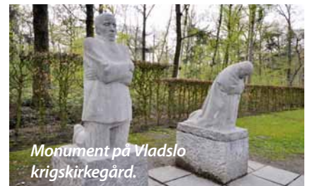
Monument på Vlagslo krigskirkegård.