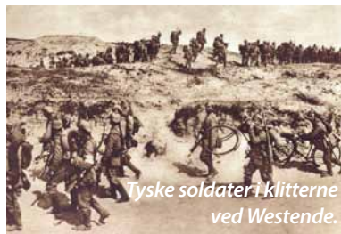
Tyske soldater i klitterne ved Westende.