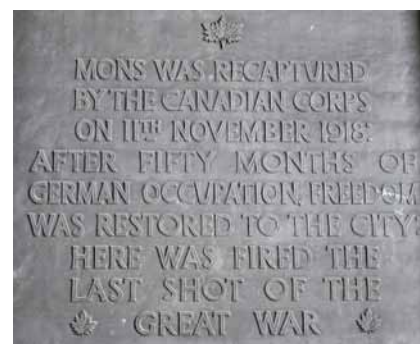
Mindeplade for krigens afslutning 1918 hænger i Rådhuset i Mons.

mindsten for slaget. Hulvejen var krigens første skyttegrav.