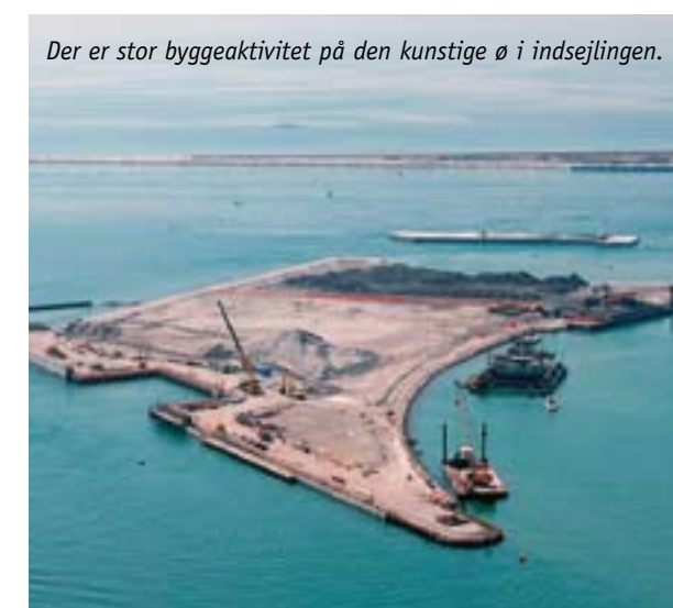
Der er stor byggeaktivitet på den kunstige ø i indsejlingen.

katastrofer. Mange venetianere husker oversvømmelserne 4. november 1966, hvor vandstanden nåede op på 194 cm over normal. Så sent som i 2002 stod vandet den 16. november 147 cm over normal vandstand.