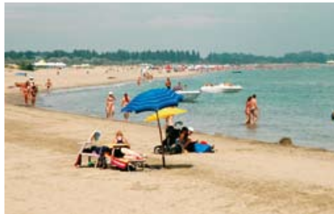
- men gudskelov ku' man gratis blive kørt ud til Adriaterkysten.

Tre år senere, i 2005 var vi atter tilbage - og nu var freden for alvor forbi. Det er nok for meget sagt, at helvede var