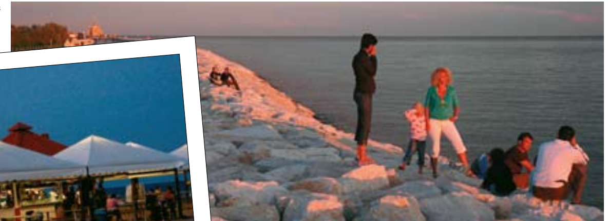
Siesta på Camping Miramare er ren rekreation.