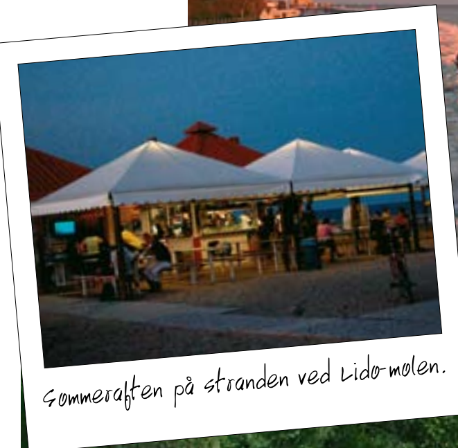
Sommeraften på stranden ved Lido-mølen.