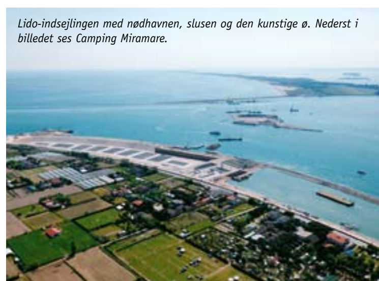
Lido-indsejlingen med nødhavnen, slusen og den kunstige ø. Nederst i billedet ses Camping Miramare.

Meget forenklet sagt, er det meningen, at sluseporte, som normalt ligger forankret i kæmpestore betonfundamenter på havbunden, i tilfælde af en truende vandstandsstigning skal rejse sig op og lukke for det indtrængende vand fra Adriaterhavet. Dette skal ske enten samtidigt eller enkeltvis ved de tre indsejlinger, som der er fra havet ind i lagunen. Det er den sydlige ved Chioggia, den midterste ved Malamocco og endelig den nordlige Lido-indsejling. Ved Lido er indsejlingen så bred, at man har valgt at dele den op i to ved hjælp af en kunstig ø. Enkelte oversvømmelser har direkte haft karakter af egentlige