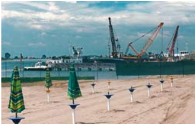
Stranden var 2005 blevet eksproprieret... ak!

I år 2000 var vi for første gang på camping på Lido'en. Vi valgte dengang at rulle støttebenene ned på den lille, hyggelige, familieejede og familiedrevne plads Camping Miramare, som ligger blot 500 m syd for færgelejet i Punta Sabbioni - og her er vi kommet siden, når vores feriemål har været Venedig. Campingpladsen hører med sine 130 pladser absolut til en af vore yndlingspladser. At det samtidig er en af Lido'ens billigste pladser, er jo heller ikke at kimse af.