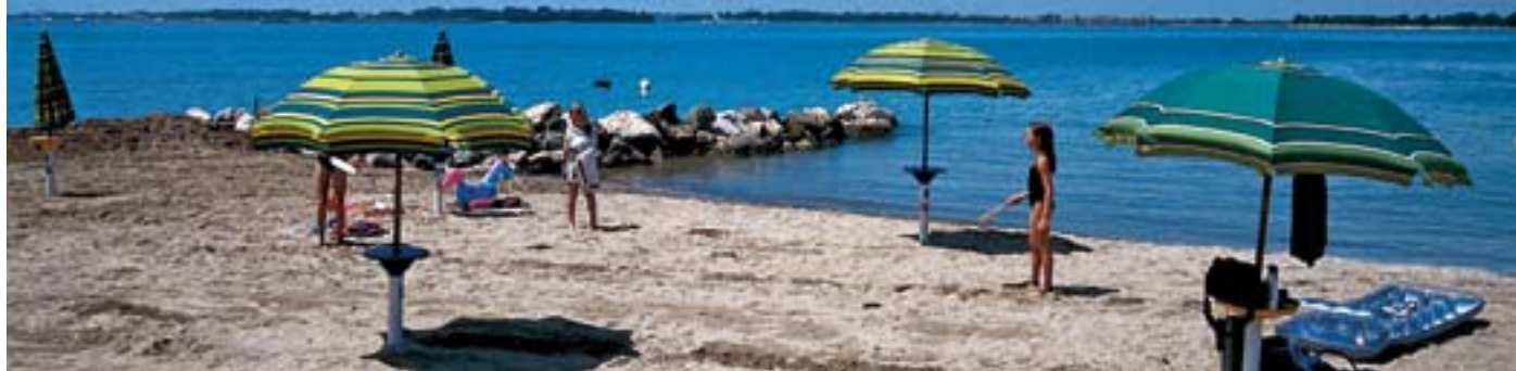
Så hyggeligt og fredeligt var der i år 2000 på Camping Miramare's lille, private lagunestrand.