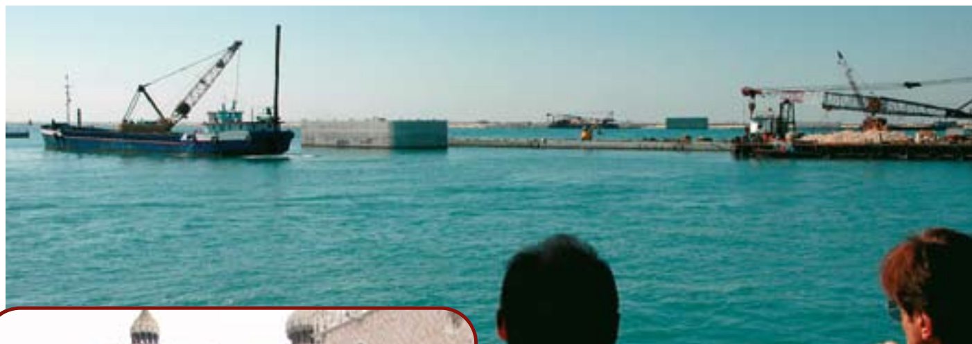
Fra færgen kan man bl.a. følge støbningen af de sænkekasser, som skal "huse" de i alt 79 sluseporte på havbunden.