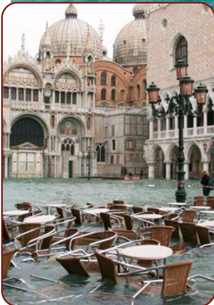
Oversvømmelse på Markuspladsen, Venedigs laveste punkt. Sammenlign med billedet på forrige side!

i byen mange gange om året. Og næsten lige så længe, byen har eksisteret, har venetianerne kæmpet mod de indtrængende vandmasser.