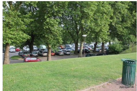
Autocamper pladsen i Metz

Det nærmeste sted, hvor der er mulighed for tømning af tanke og få vand, er autocamperpladsen i Metz. Det er gratis at tømme tanke og få vand på. Pladsen er rigtig god for en tur rundt i Metz, der er en dejlig by. Hvis det frister, er det indendørs markedet over for den store kirke et besøg værd.