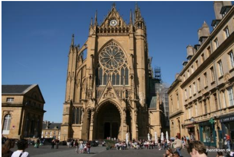
Kirken i Metz med markedshallen til venstre

Der er rigemuligheder for indkøb indenfor få km. Lavprismarkeder, og mega indkøbscentre. Et godt sted for indkøb af godt udendørs- og sportstøj samt sportsudstyr er Decathlon, med rimelige priser og god kvalitet. De har deres eget mærke Quechua (opkaldt efter indianerne i Ecuador, Bolivia og Peru) og så er der mærkevarer. http://www.decathlon.fr/