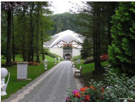
Indgangen til Thermapolis

I dag er byen ren med masser af bede og blomster, slaggebjergene er forvandlet til en oase med mange aktiviteter. Her er en meget fin Zoologisk have, golfbane, biografer, indendørs skibakke der er 110 meter lang og -3 grader. www.amneville.com .